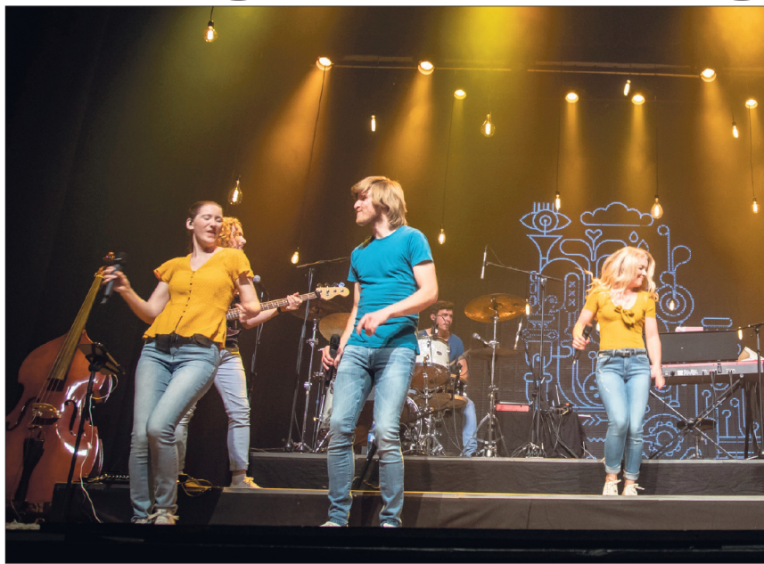
SPILLELISTA 2019: Samstern, harmonisk og vakker fra start til slutt.